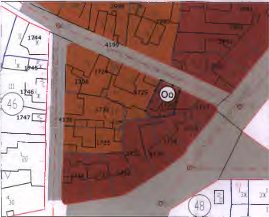
Скица с изменение на ОУПО Севлиево, за ПИ 65927.501.1726, по КККР на гр. Севлиево, общ. Севлиево М 1:1000