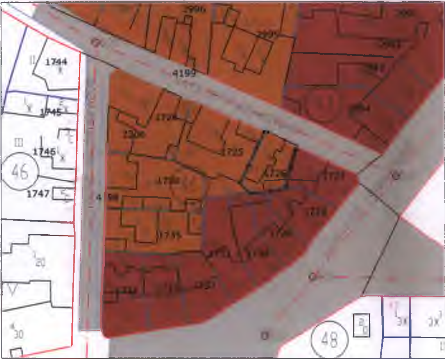
Извадка от действащия ОУПО Севлиево, за ПИ 65927.501.1726, по КККР на гр. Севлиево, общ. Севлиево М 1:1000